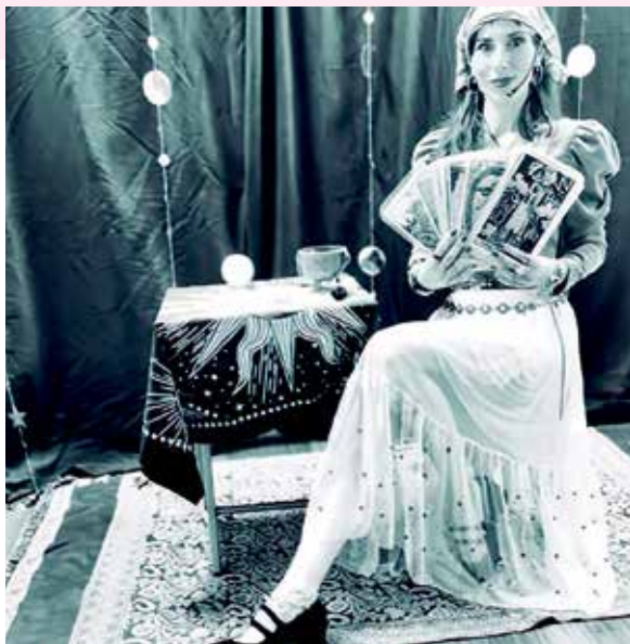
Orakulua antzezlanaren irudia